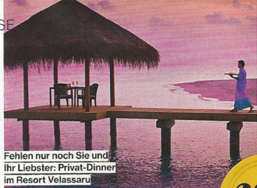
Fehlen nur noch Sie und Ihr Liebster: Privat-Dinner im Resort Velassaru