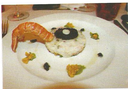
Mille-feuilles de langoustines aux pommes vertes et caviar