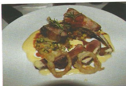
Carré d'agneau rosé et noisettes minute aux petits légumes confits