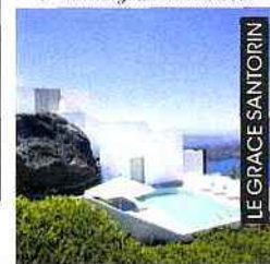
LE GRACE SANTORIN