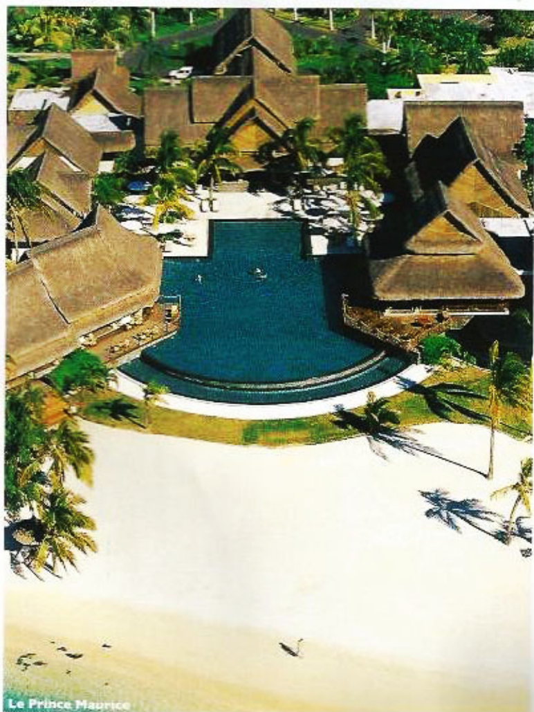
Le Prince Maurice